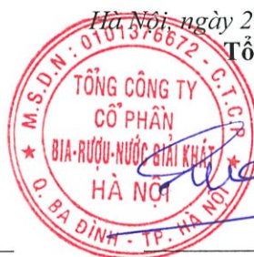
Ngô Quế Lâm